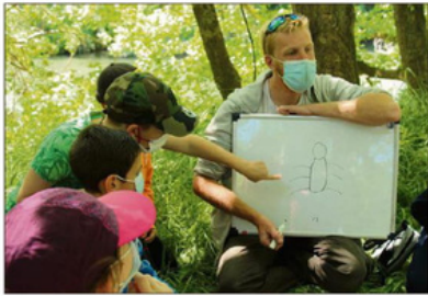
Les jeunes élèves ont été sensibilisés à la flore et la faune existantes aux abords de l'Argens.